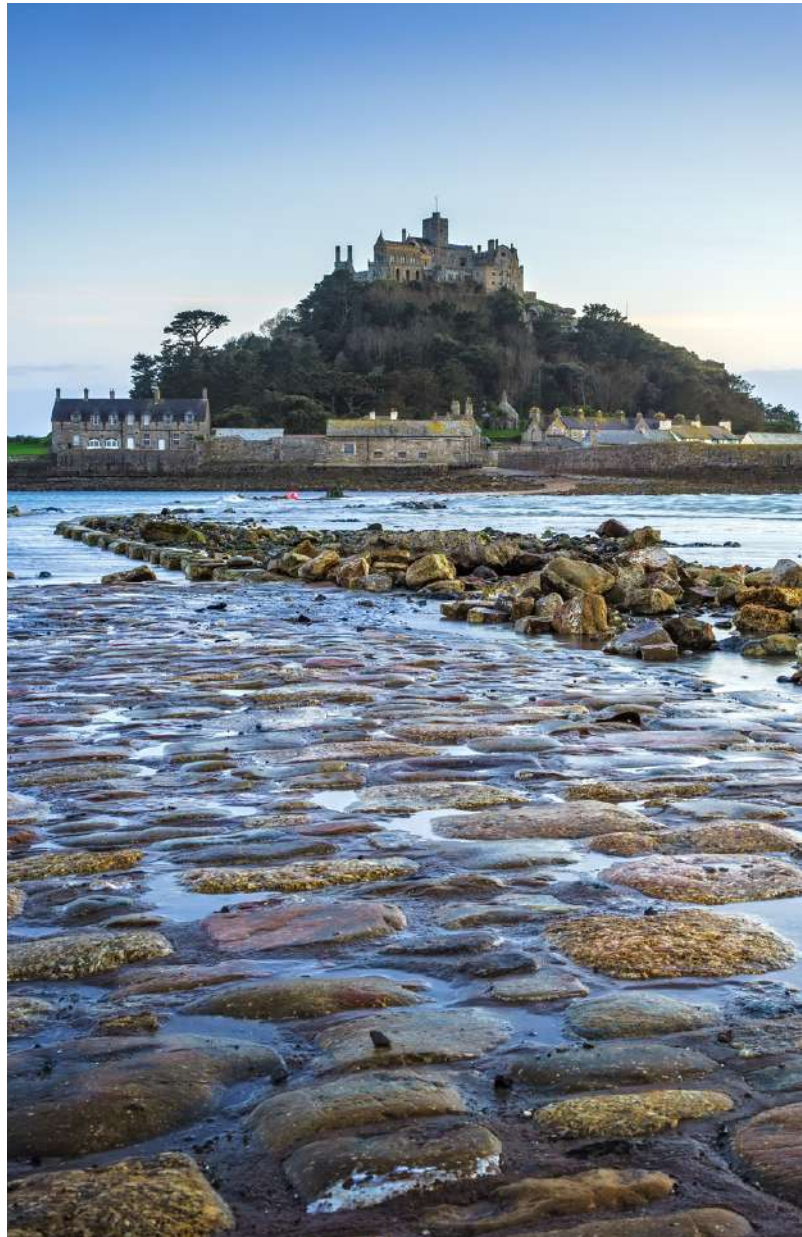
St. Michael's Mount in Engeland