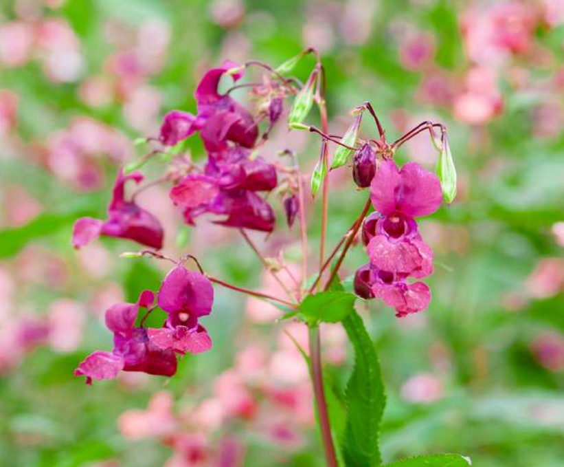
Reuzenbalsemien ( Impatiens glandulifera )

“Het was bijzonder om zo snel en ook fysiek te ervaren wat de remedie teweegbracht.”