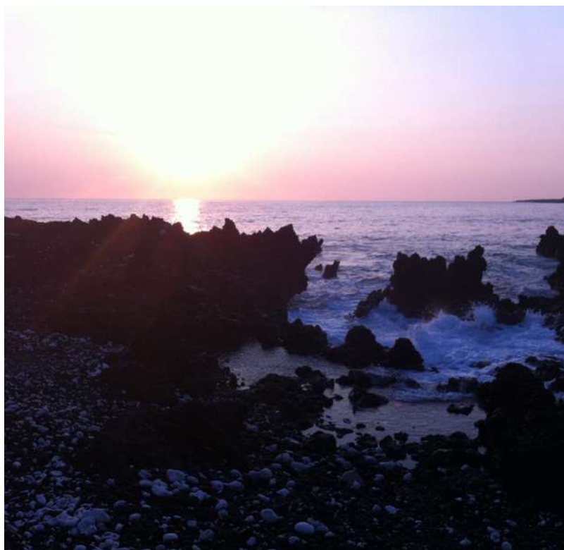
'Manini Beach' (Kāpahukapu) in Hawaii